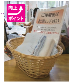
▲雨の日用貸し出しタオル

委員会のメンバーは、センター長、サポート部1名、環境整備委員長1名、地域支援室1名、栄養部1名、オブザー