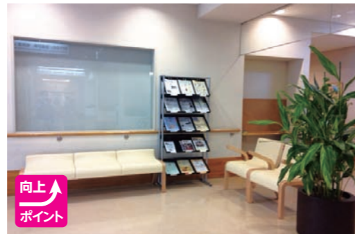
▲待機エリアを設置