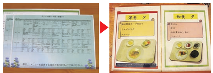
▲今までのメニュー表示