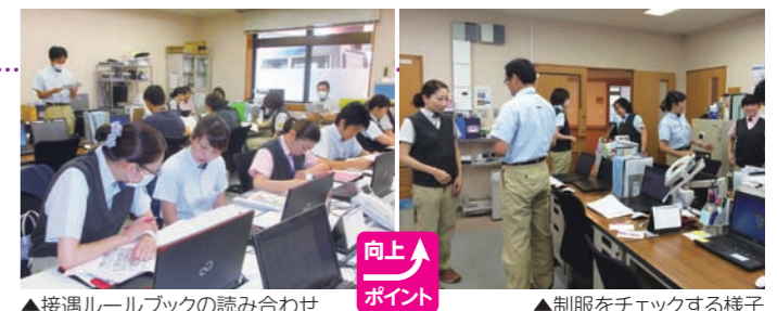
▲接遇ルールブックの読み合わせ

「『わたしたちの約束』の読み合わせ」においては、輝生会の接遇のポイントやルールを再度確認し、忙しい日々の業務の中でも自然に振舞うことができるよう、全職員が身体にしみ込ませる思いで取り組んでおります。そんな努力の