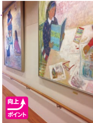
▲絵画の位置を修正

「ご意見」に耳を傾け対処することは、患者密着型、患者参加型の医療サービスと考え、今後もサービス向上に努めていきたいと考えております。