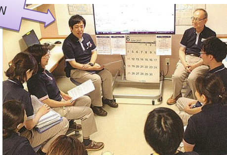
■カンファレンスで 患者・家族の代弁とアセスメントをプレゼンします 「患者さまはいまこのような気持ちでいて、将来はこうなりたい、とイメージしています」