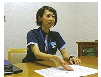
■インテーク面接中 「わたしがあなたの入院中の担当SWです」

在宅復帰を目指す回復期では、SWはコーディネーター。患者・家族の想いを汲み取り、社会資源活用の情報提供、そして他職種を俯瞰し、鳥の目で見渡してくれています。多職種から尊敬される専門職です。 (リハケア局長 Ns)